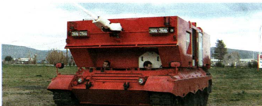
ΤΟ JUMBO Track Multi είναι απλώς ένα μετασκευασμένο Leopard, που αντί για κανόνι βλημάτων εξοπλίστηκε με κανόνι νερού και δεξαμενές χωρητικότητας 15.000 λίτρων

Η ιδιωτική πρωτοβουλία είναι εκείνη που την τελευταία στιγμή διέσωσε τον ιερό χώρο και μαζί του τις τελευταίες ρανίδες εθνικής αξιοπρέπειας. Το ερπυστριοφόρο